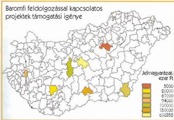
Készítette: VÁTI Kht. Országos Vidékfejlesztési Iroda, 2001